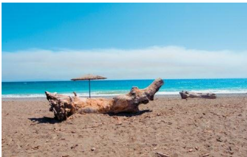
Η παραλία Κρύα Βρύση.

Ο κύριος πόλος έλξης της περιοχής είναι η Μονή του Οσίου Ιωάννη του Ρώσου, η οποία εορτάζει στις 27 Μαΐου, ημερομηνία θανάτου του Αγίου σε ηλικία 40 χρονών το 1770. Ο ναός χτίστηκε προς τιμήν του προκειμένου να φιλοξενήσει το ιερό λείψανό του, που μετέφεραν οι πρόσφυγες από την Μικρά Ασία. Αποπερατώθηκε το 1951 κι από τότε χιλιάδες πιστοί -μεταξύ των οποίων και πολλοί Ρώσοι- συρρέουν κάθε χρόνο για να προσκυνήσουν τη χάρη του, αρκετοί από αυτούς διανύοντας μεγάλες αποστάσεις με τα πόδια ή ακόμα και γονυπετείς.