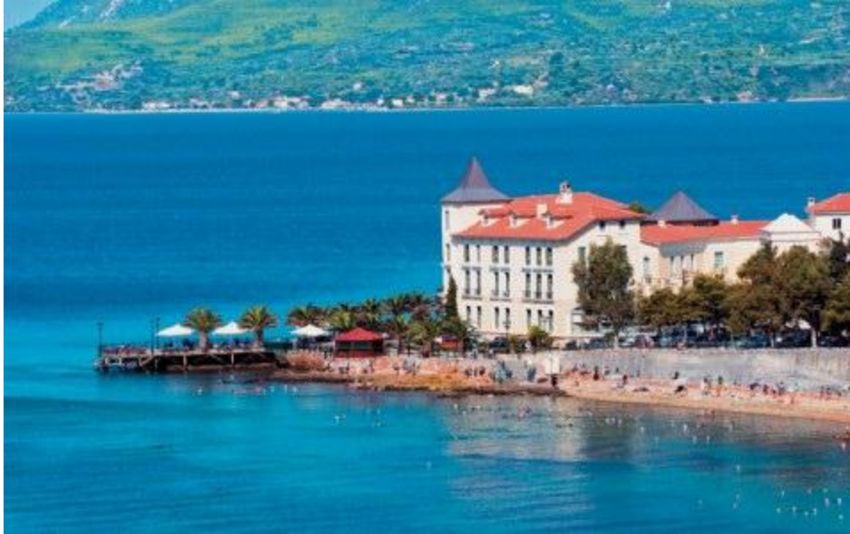
Το ιστορικό ξενοδοχείο, σημερινό Θέρμαι Σύλλα.

Ο Σύλλογος Ιδιοκτητών Υδροθεραπευτηρίων Αιδηψού αποτελείται από 20 μέλη τα περισσότερα εκ των οποίων είναι ιδιοκτήτες ξενοδοχείων SPA. Ενδειξη ότι η Αιδηψός χαρακτηρίζεται από έντονη εποχικότητα, αποτελεί το γεγονός ότι από τα 120 ξενοδοχεία που διαθέτει, μόνο τα 20 παραμένουν ανοιχτά όλες τις εποχές. Εμείς πάντως θα σας παροτρύνουμε να επισκεφθείτε τη λουτρόπολη, εκτός σεζόν επωφελούμενοι των ιδιαίτερα συμφερόντων εκπαιδευτικών πακέτων για όλη την οικογένεια.