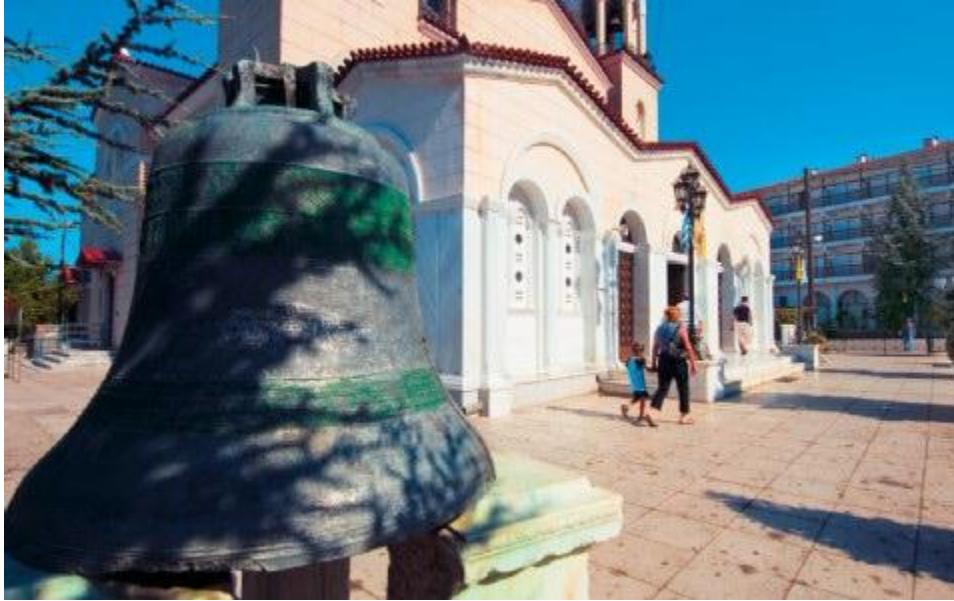
Μονή του Οσίου Ιωάννη του Ρώσου.

Εκτός από τα μπάνια, ο τόπος προσφέρεται και για πεζοπορίες μέσα στα δασοσκέπαστα μονοπάτια. Ειδικότερα, θα σας προτείνουμε να επισκεφθείτε το εκκλησάκι της Ζωοδόχου Πηγής με τα ερείπια παλαιοχριστιανικής βασιλικής χτισμένης πάνω σε ρωμαϊκά λουτρά.