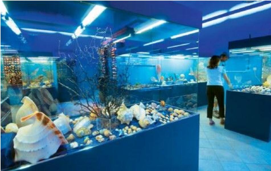
Το ιδιαίτερο μουσείο «Ναυτίλος».

όμως όπου ο Ωνάσης, η Γκρέτα Γκάρμπο, η Μαρία Κάλλας, ο Τσόρτσιλ ή ο Μενέλαος Λουντέμης, έρχονταν στην Αιδηψό έχει περάσει ανεπιστρεπτί. Τα χρόνια που ακολούθησαν δεν ήταν τόσο ρόδινα. Η τουριστική κίνηση μειώθηκε και αρκετές επιχειρήσεις έκλεισαν.