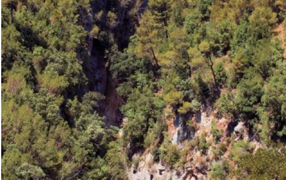
Το φαράγγι της Μπουλοβίνας.