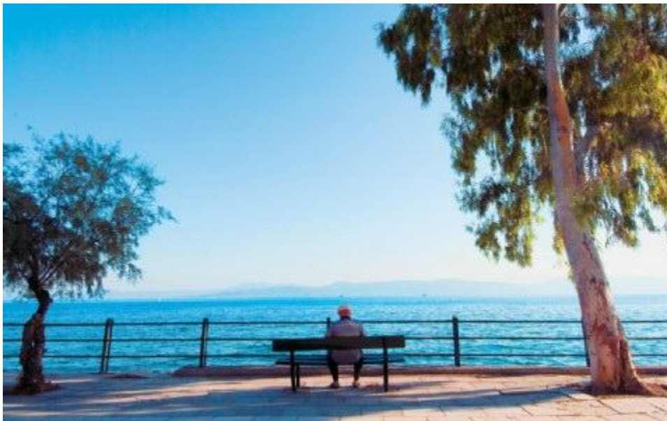
Αγναντεύοντας τη θάλασσα.

Και μετά τα αξιοθέατα και τις βόλτες στην παραλία με τα καφέ, τα ζαχαροπλαστεία και τις ταβέρνες, έρχεται η στιγμή να «καταναλώσεις» το πιο ποθητό «προϊόν» της πόλης: το ιαματικό νερό της. Τα Λουτρά Αιδηψού διαθέτουν περισσότερες από 80 ιαματικές πηγές: το νερό τους κυμαίνεται από 28 έως 86 βαθμούς Κελσίου. Θα το απολαύσετε στην αμμώδη παραλία όπου χύνονται δεκάδες ιαματικές πηγές, ή σε ατομικούς λουτήρες και σε πισίνες, σε ιδιωτικά υδροθεραπευτήρια της πόλης ή στο θεραπευτήριο του ΕΟΤ. Είναι μια μοναδική εμπειρία. Το στρες αφανίζεται, οι πόνοι ξεθυμαίνουν, το μυαλό ηρεμεί. Είναι η αίσθηση προσωρινής ευτυχίας που έτσι κι αλλιώς προσφέρει η επαφή με το νερό - που στην περίπτωση αυτή είναι και «θαυματουργό».