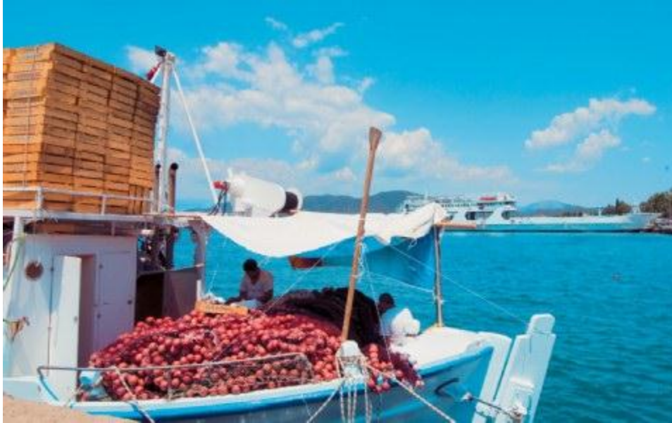
Στο λιμανάκι της Αιδηψού.

Οι εμπειρογνώμονες που υπάρχουν στα ξενοδοχεία SPA και τα λουτροθεραπευτήρια της Αιδηψού μπορούν να λειτουργήσουν συμβουλευτικά σε σχέση με τυχόν ενοχλήσεις, μυϊκούς πόνους και διάφορα συμπτώματα που εντοπίζετε. Τα υπόλοιπα αφήστε τα στα θεραπευτικά νερά. Αλλωστε το λέει και η μοντέρνα λέξη SPA, που έχει τις ρίζες της στη ρωμαϊκή εποχή από τα αρχικά των λέξεων Sanus Per Aqua, δηλαδή θεραπεία μέσα από το νερό.